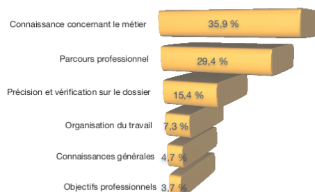
Graphique 2 : Questions du jury

Candidats recevables en 2007