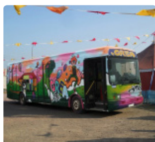
Spectacle jeune et tout public (dès 6 ans) / durée : 50 minutes

« Le Ciel Presque » est un projet qui permet de réunir plusieurs éléments : le monde du spectacle, celui des enfants, la sensibilisation au thème de la prévention de l'illettrisme et au goût de la lecture.