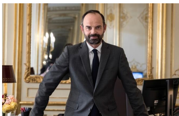
Édouard Philippe, extraits du discours aux Départements, lancement de la contractualisation État-départements, 21 février 2019

« Des hauts-commissaires entièrement dédiés à l'accompagnement de la mise en œuvre de la stratégie pauvreté seront présents dans chaque région : ils seront des interlocuteurs privilégiés, qui connaissent la réalité des territoires. Vous pouvez donc être assurés que l'État est pleinement investi, sur le terrain, pour que cette stratégie pauvreté aide à changer la vie de nos concitoyens les plus précaires. »