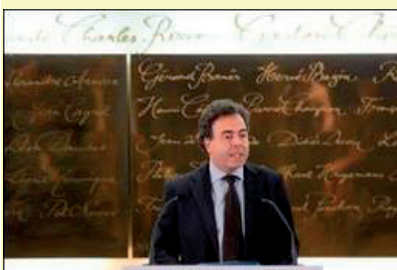
Luc CHATEL lors de son discours le 29 mars 2010 au salon du livre

Télécharger ce numéro sur le site de l'ANLCI : www.anlci.gouv.fr