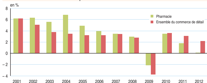
1 Taux de croissance annuels des chiffres d'affaires du secteur de la pharmacie et du commerce de détail depuis 2000

Lecture : en 2001, le chiffre d'affaires du secteur de la pharmacie a augmenté de 6,2 % par rapport à 2000. Source : Insee, comptes du commerce, base 2010.